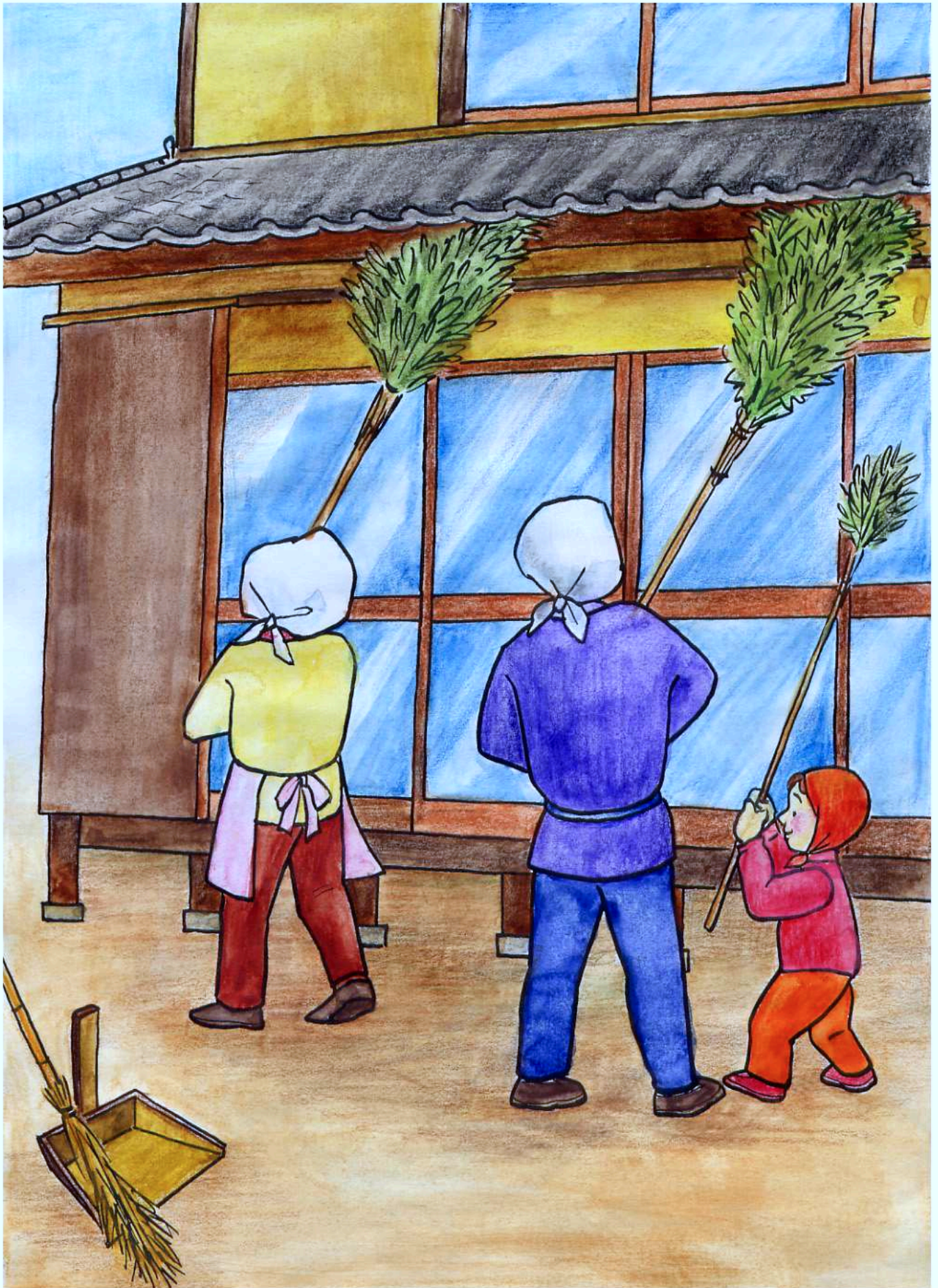
煤払い (すすはらい)